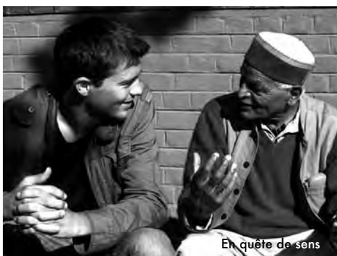
En quête de sens

En partenariat avec l'Association Colibris. Échange à l'issue de la séance et goûter offert.