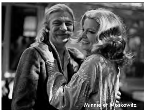
Minnie et Moskowitz

Romanse désabusée et dépolitisée qui échappe aux codes du genre ou s'en joue régulièrement, Minnie et Moskowitz oscille entre rires, larmes, et chocs affectifs. (...) Et si la magie opère, c'est bien sûr grâce aux comédiens, aux dialogues absolument magnifiques mais surtout à la caméra de Cassavetes qui sait capturer comme personne ces instants d'intimité entre deux êtres communs et pourtant fascinants. www.ecranlarge.com