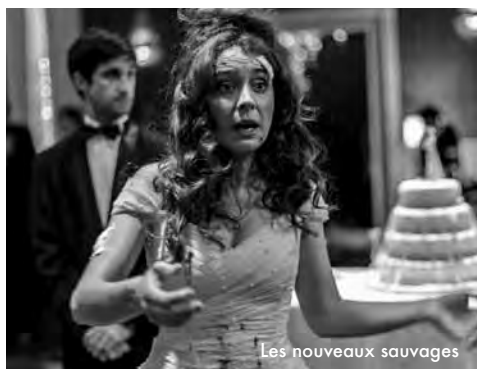
Les nouveaux sauvages

Les Nouveaux Sauvages remet au goût du jour la formule du films à sketches pour suivre les pétages de plomb de victimes humiliées décidant enfin de se révolter. (...) Mais cette critique sociale n'est qu'un vague canevas. Le propos du film, plus modeste, se rapprochant en réalité du sympathique God Bless America de Bob Goldwaith qui voyait un duo improbable embarqué dans un road-movie sanglant pour régler leurs comptes à tous les cons. (...) Cette noirceur bon enfant devient souvent réjouissante, quand le passage à l'acte mobilise des instruments et des techniques variées. Des couteaux, des avions, des voitures, des explosifs. Tout en restant familiale, la drôlerie évite le consensuel et assume son petit côté punko-trash. Les nouveaux sauvages fait un bien fou et bénéficie à fond de son effet cathartique. Une belle surprise. toutelaculture.com