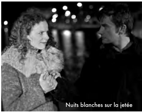
Nuits blanches sur la jetée