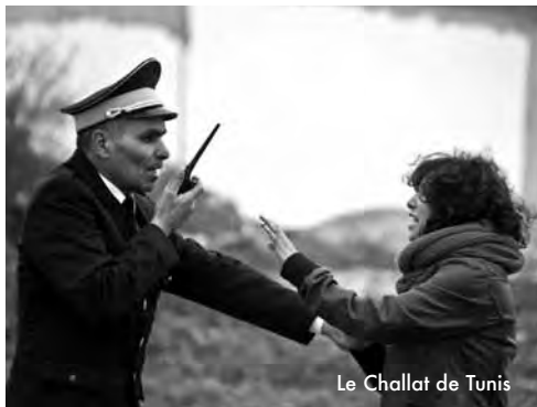
Le Challat de Tunis