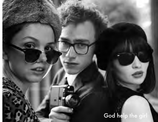
God help the girl